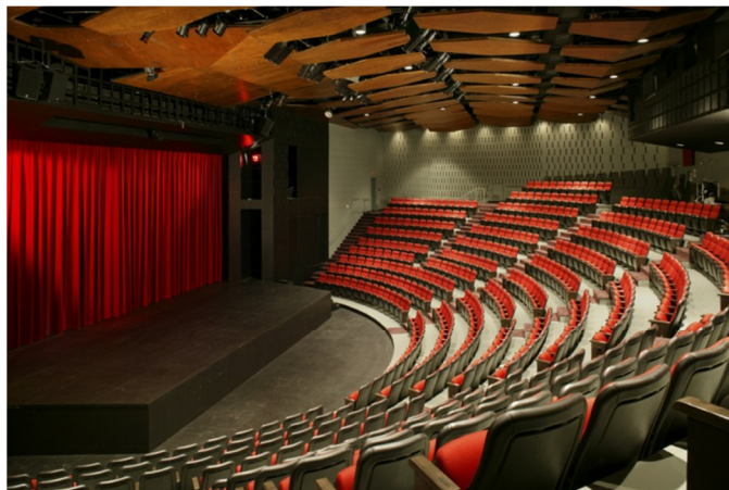
L'auditorium du Théâtre Centennial avec son ascenseur en position élevée.

L'auditorium comprend 550 sièges fixes distribués dans un amphithéâtre de 170°. Tous les sièges sont cousinés et numérotés. Jusqu'à 50 chaises supplémentaires peuvent être ajoutées dans la fosse en fonction de la position de l'ascenseur de scène. La capacité légale maximale est de 650 personnes.